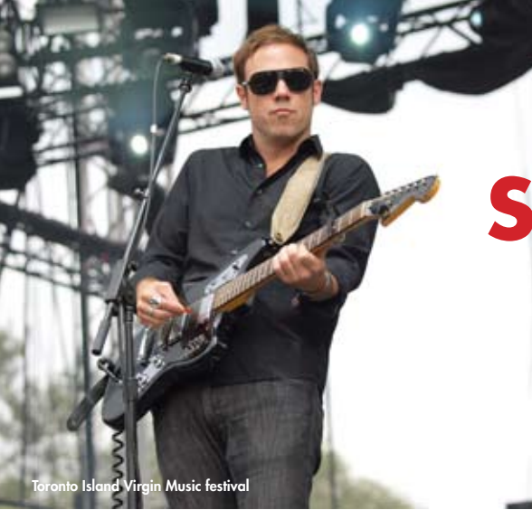
Toronto Island Virgin Music festival