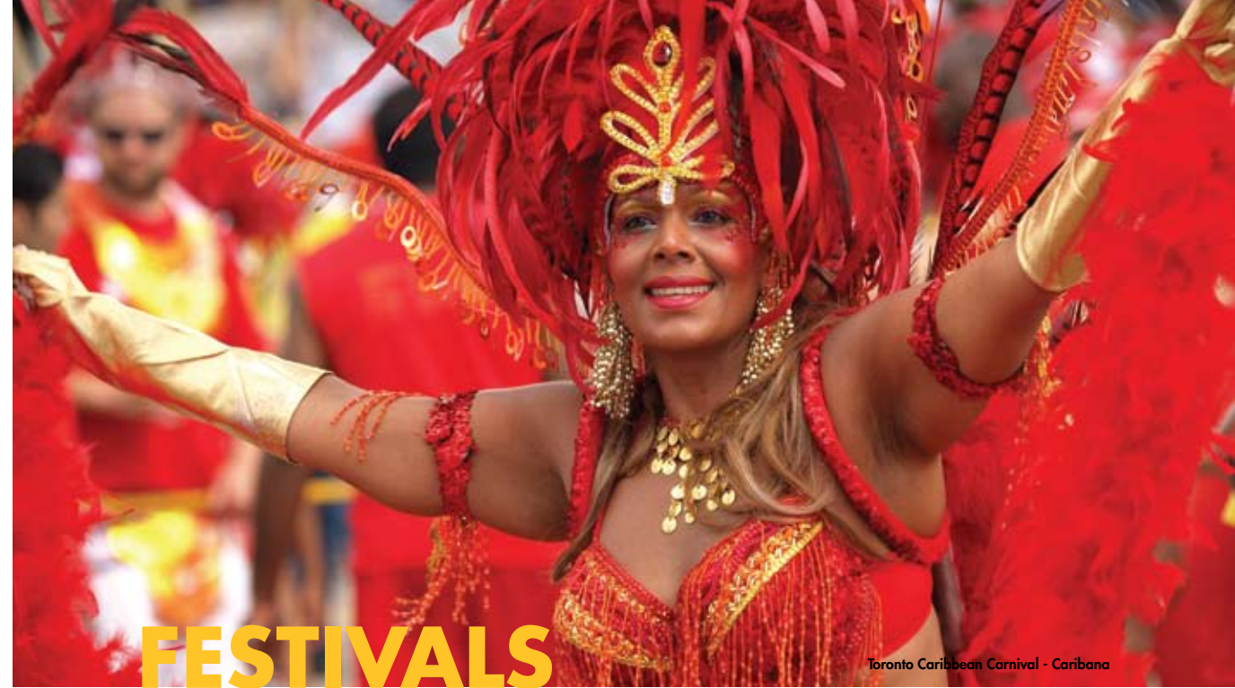
Toronto Caribbean Carnival - Caribana