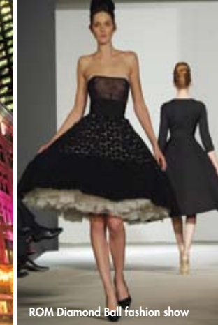
ROM Diamond Ball fashion show