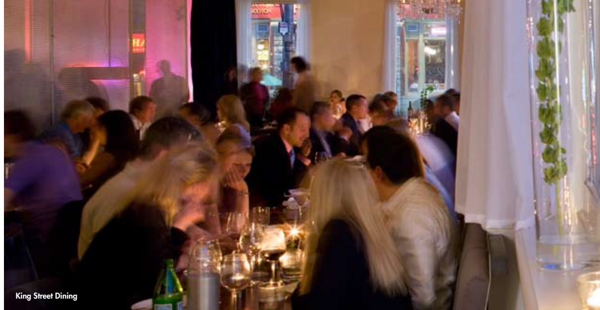
King Street Dining

St. Lawrence Market: Torontos lebhafter Farmer's Market, in einer hangarähnlichen Halle an der Front Street. Hockey Hall of Fame: Die Ruhmeshalle des kanadischen Nationalsports, mit den handsignierten Schlägern Masken und Handschuhen der kanadischen Eishockey-Göttern und dem in einem begehbaren Safe aufbewahrten Stanley Cup. Front Street. Church Wellesley Village: Einige der schrillsten Läden und besten Restaurants befinden sich hier. Das sich rund um die Church Street konzentrierende Schwulenviertel steht für Toleranz und Lebensfreude. PATH: Downtown Toronto ist im Übrigen unterkellert. PATH-Hinweisschilder führen hinab in ein Network aus insgesamt 27 Kilometer langen Fußgängertunneln, die Läden, Boutiquen und Restaurants auf mehr als 370 000 Quadratmeter Verkaufsfläche miteinander verbinden.