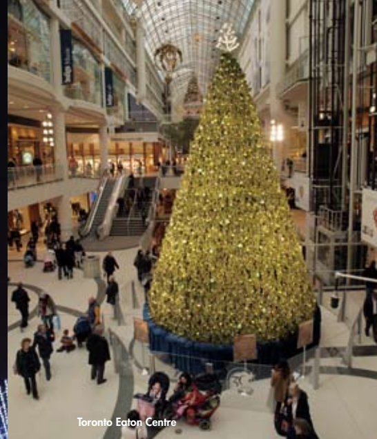
Toronto Eaton Centre