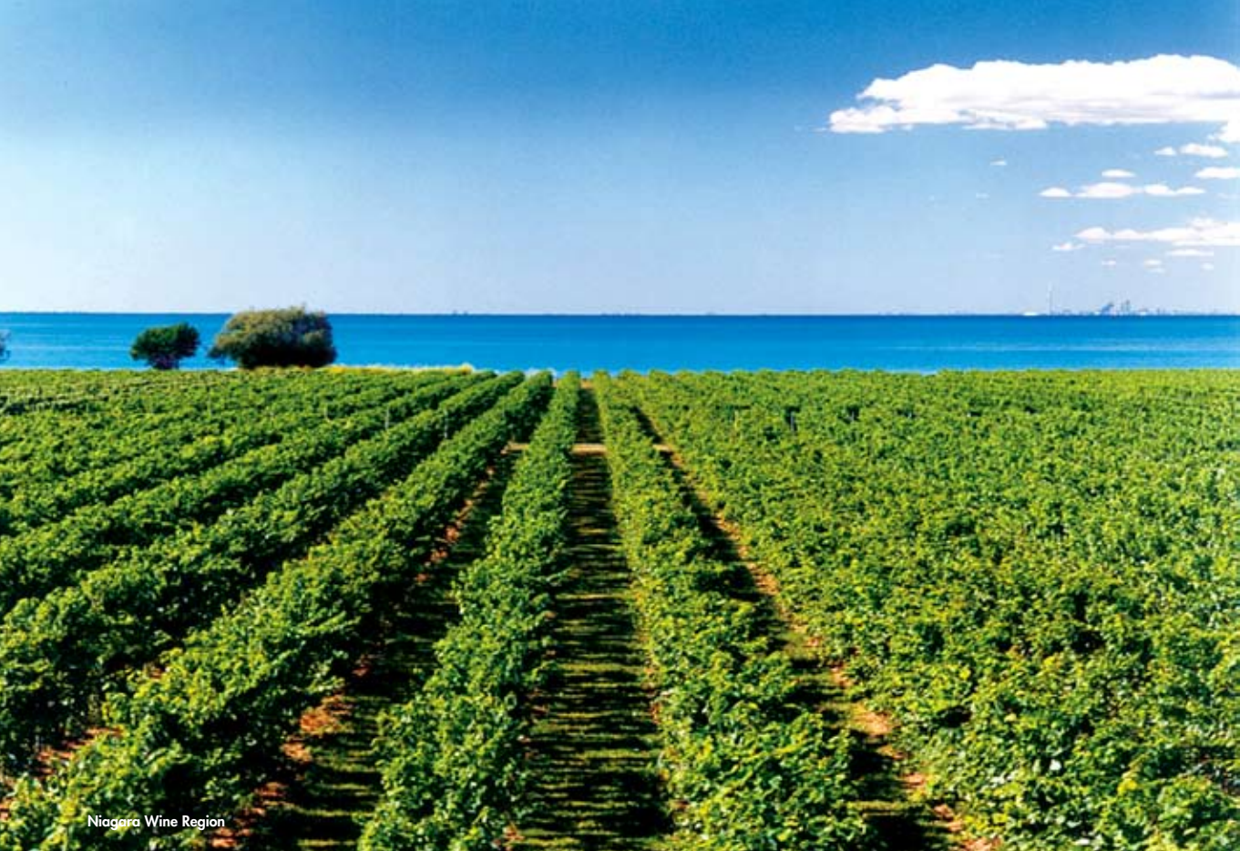
Niagara Wine Region