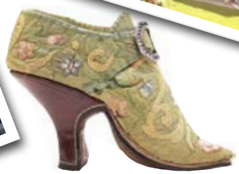
Bata Shoe Museum