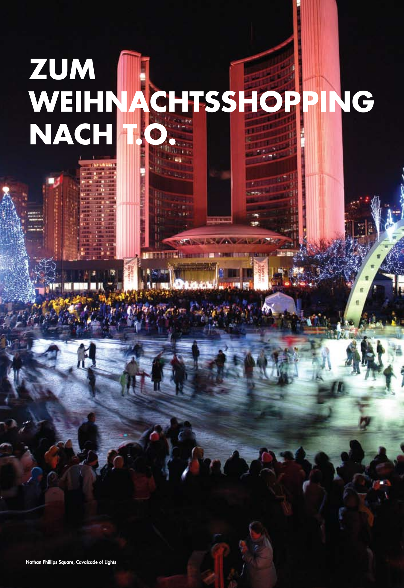
Nathan Phillips Square, Cavalcade of Lights