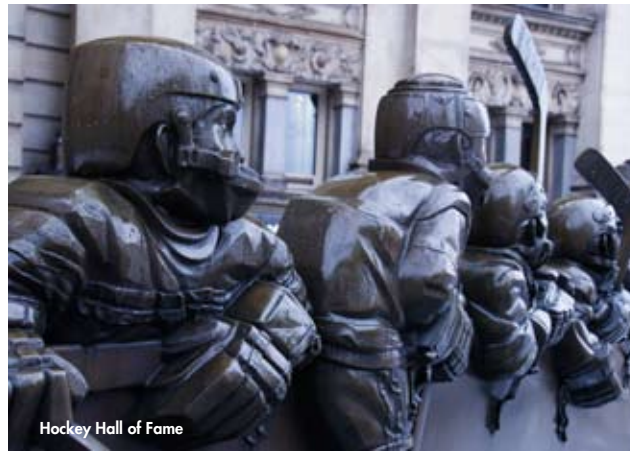
Hockey Hall of Fame