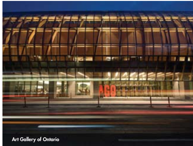
Art Gallery of Ontario