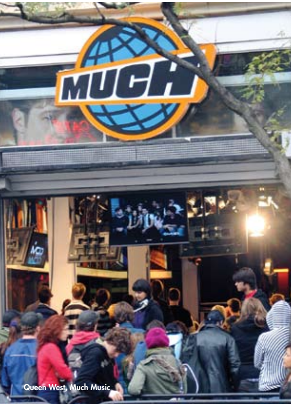
Queen West, Much Music