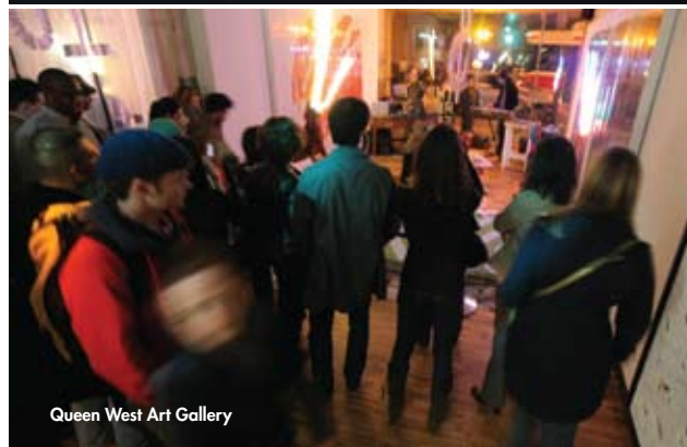
Queen West Art Gallery