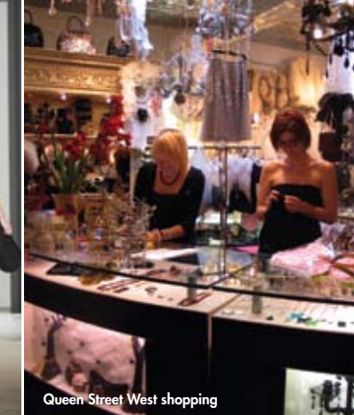
Queen Street West shopping